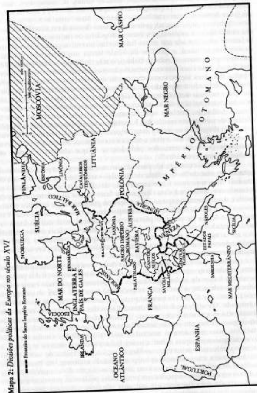
Mapa 2: Divisões políticas da Europa no século XVI

O clima variado da Europa levou a produtos também variados, adequados à troca; com o tempo, desenvolvendo-se as relações de mercados, eles foram transportados pelos rios ou pelos caminhos cortados na floresta, entre uma área de povoamento e a área contígua. Provavelmente, a característica mais